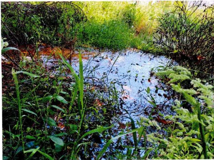
Détail des irisations