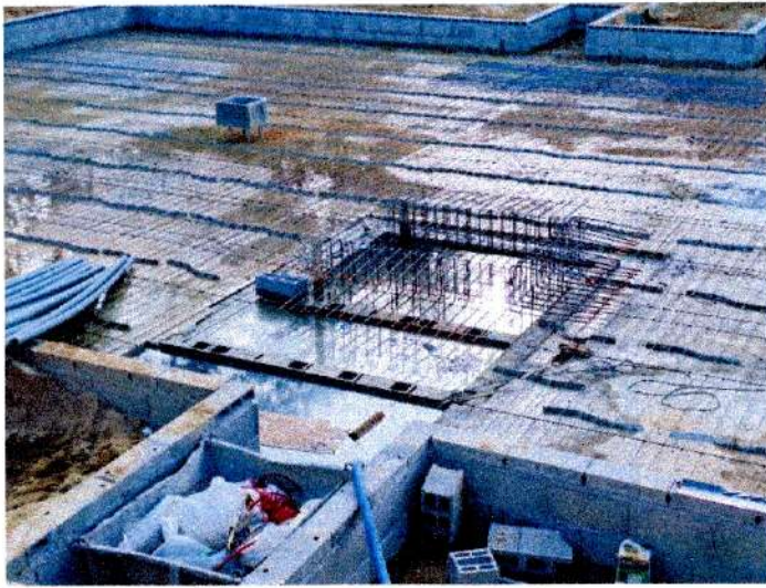
Départ de l'évacuation